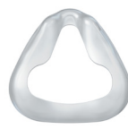
Мягкая насадка маски CARA Разм. XS: WM 25189 Разм. S/M: WM 25238 Разм. M/L: WM 25239 Разм. XL: WM 25576