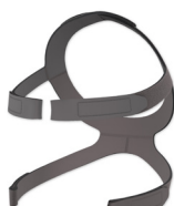
Оголовье XL CARA/CARA Full Face без зажимов ремней оголовья WM 25338