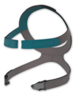
Оголовье CARA с зажимами ремней оголовья XS: WM 25191 Стандарт: WM 25192