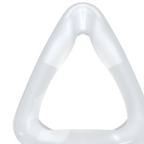
Мягкая насадка маски CARA Full Face Разм. S: WM 25601 Разм. M: WM 25602 Разм. L: WM 25603 Разм. XL: WM 25676