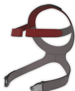
Оголовье CARA Full Face с зажимами ремней оголовья WM 25243