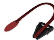
Шнур для быстрого снятия CARA Full Face WM 25623

Дополнительная информация о наших терапевтических решениях, принадлежностях и системах масок имеется на сайте loewensteinmedical.com