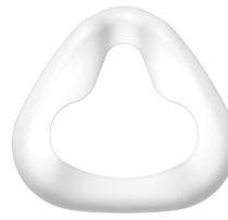
Almofada da máscara JULIA

Tam. S: LMT 26636 Tam. M: LMT 26637 Tam. L: LMT 26638