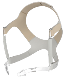
Arnês para a cabeça JULIA incl. clips do arnês