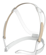
Kopfbänderung JULIA inkl. Bänderungsclips LMT 26714