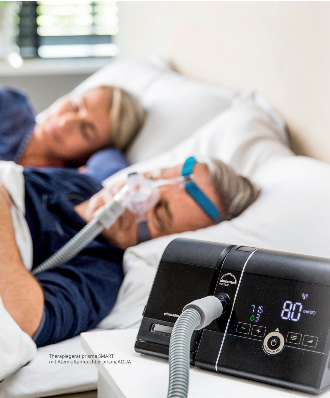
Therapiegerät prisma SMART mit Atemluftanfeuchter prismaAQUA