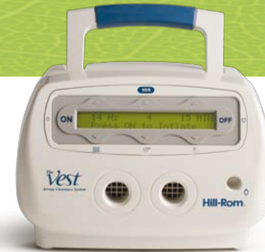
Leichte, flexible Einstellung